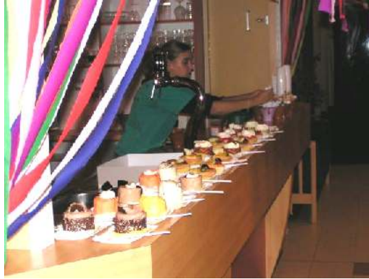
Koffie met gebak staat klaar