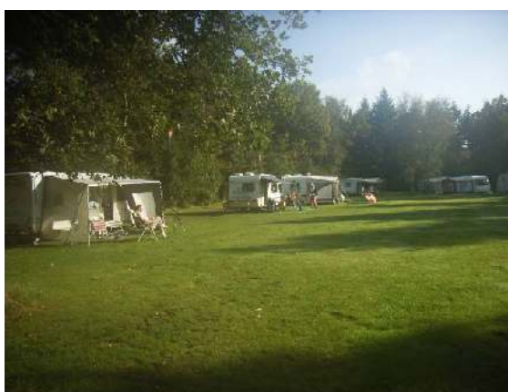
De vroegkomers genieten nog van een zonnetje

Enmaal aangekomen op de camping werd er druk handjes geschud, voorgesteld én koffie gezet.