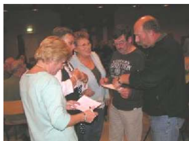
Veel overleg om tot goede antwoorden te komen

Heel boeiend, het is een prachtig gebied. Na de film werden er doorgeknippte speelkaarten uitgedeeld zodat een ieder zijn/haar partner moest zoeken en kregen we 10 typisch Friese vragen voorgeschoteld, waar de meest variabele c.q. hilarische antwoorden op werden gegeven.