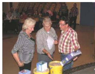
De beste antwoorden beloond met een prijs