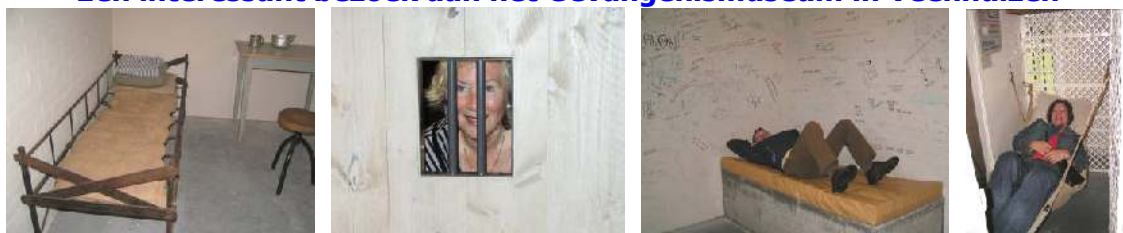
Veel Elddis leden verdwenen achter de tralies