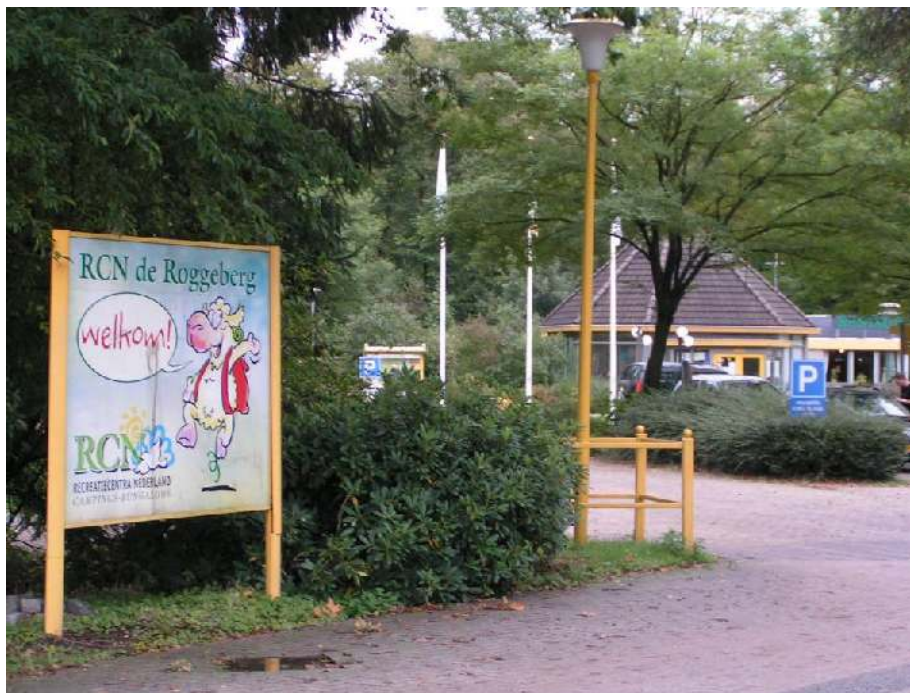
Welkom op De Roggeberg

Dat hebben we meteen gedaan, evenals het inschrijven voor het najaarsweekend. Vol goede moed reden we naar Recreatiepark De Roggeberg in Appelscha, het veelzijdig(st)e stukje Fryslân. Prachtig weer onderweg trouwens.