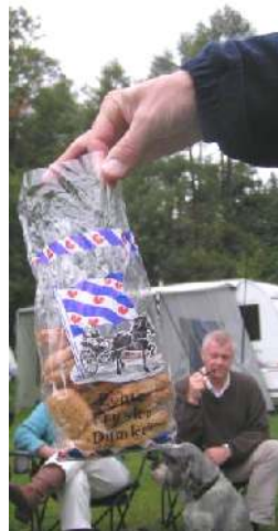
Tijdens de koffie (met als koekje een Frysk Dumke) wordt het weekend officieel afgesloten