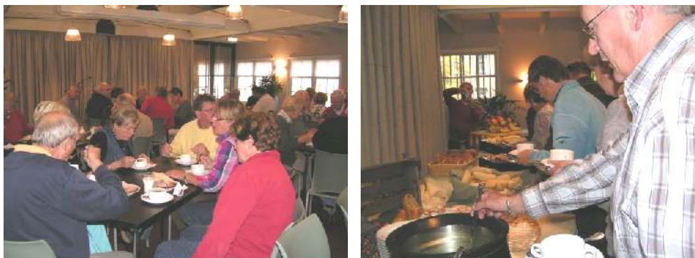
Een goed verzorgd buffet!

Om 11.30 uur werden we getrakteerd op een overheerlijke lunch, waarna iedereen zijns weegs kon gaan.