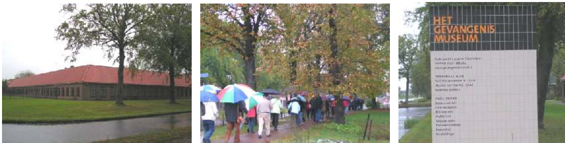
Een interessant bezoek aan het Gevangenis­museum in Veenhuizen

Zaterdagochtend bijtijds reveille want om 08.45 uur was het verzamelen om een bezoek te brengen aan het Gevangenis­museum in Veenhuizen. Een gevangenis waarin vroeger landlopers en dronkaards werden opgesloten; tegenwoordig zitten ook plegers van heel ander kaliber hier achter de tralies. Helaas was niet alles goed te volgen, omdat de groepen een beetje te groot waren (overigens veroorzaakt door het verstek laten gaan van vrijwilligers van het museum).