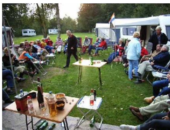
Gezellig bijpraten met een hapje en drankje

Na een uurtje begon het te regenen en dat is het hele weekend zo gebleven, maar dat mag bij een beetje kampeerder de pret natuurlijk niet drukken en dat gebeurde ook niet.