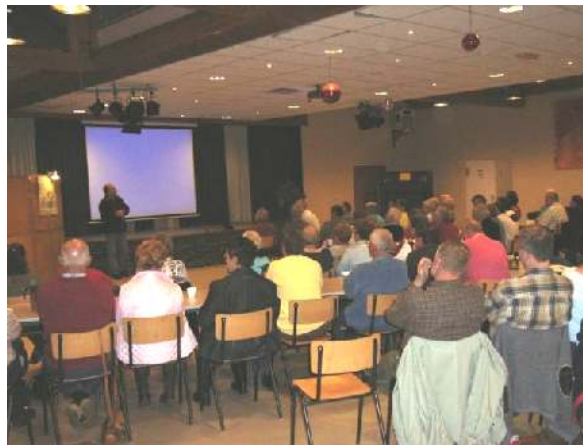
Interessante informatie over Nationaal Park "Drents-Friese Wold"